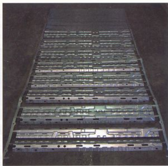
Fig. 6 La "striscia" relativa alla produzione dei longheroni descritti