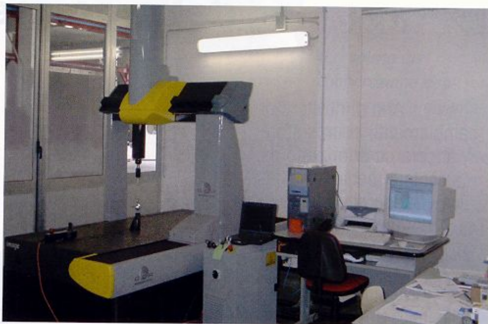
Fig. 7 Un aspetto della sala metrologica della Meccanotecnica Centro S.p.A.: una cmm Dea permette i più rigorosi controlli geometrici e dimensionali sui pezzi di qualunque geometria e complessità

zata nella progettazione e costruzione di linee di saldatura, asservimenti per presse, linee pannellatrici, nastri trasportatori, impianti di movimentazione in generale, impianti per il settore della plastica. Grazie a un'esperienza ormai trentennale, l'azienda è in grado di fornire produzioni ad alta tecnologia per i più importanti settori industriali. Con un'eccellente dotazione di mezzi di lavorazione e di controllo, la produzione può essere agevolmente realizzata nel rispetto delle più severe specifiche tecniche dei committenti.