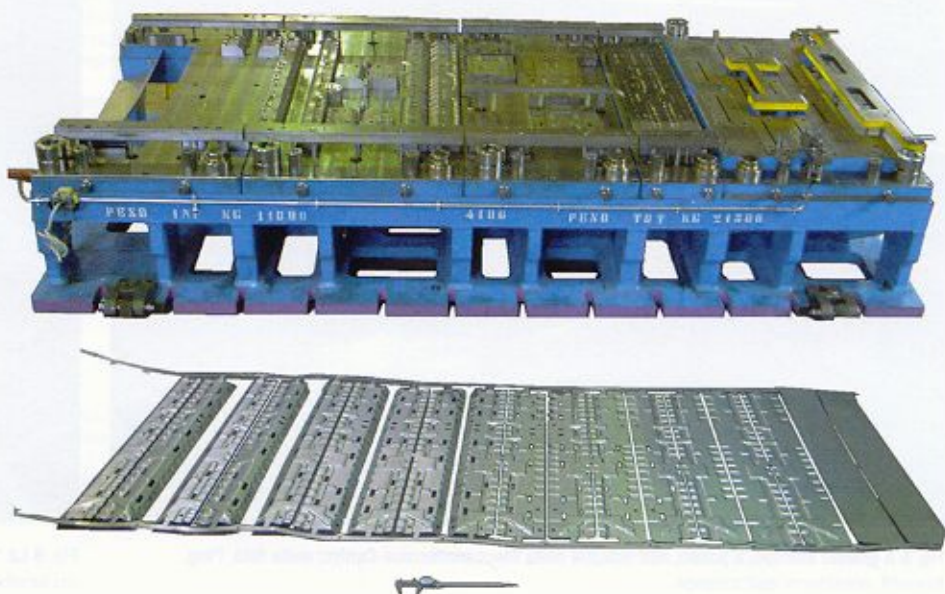
Fig. 2 Stampo per la produzione del longherone di fig. 1: si tratta di stampo a passo, caratterizzato da 11 stazioni e produce un pezzo destro ed uno sinistro finiti e pronti per il montaggio alla cadenza di 18...20 pezzi/min

Il progetto è partito dalla matematica del pezzo fornita dal committente. Nel proprio ruolo di fornitore di primo livello, lo stampista Meccanotecnica Centro Srl ha però cooperato con il committente in ambito di co-design allo scopo di rivedere criticamente il pezzo e ottimizzarlo per la produzione da stampo, cercando di renderlo più facil-